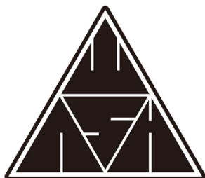
WHITE ASH ロゴ