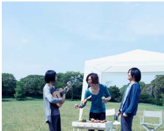
People In The Box

【出演】People In The Box(アコースティック ver.) / Akira Kosemura