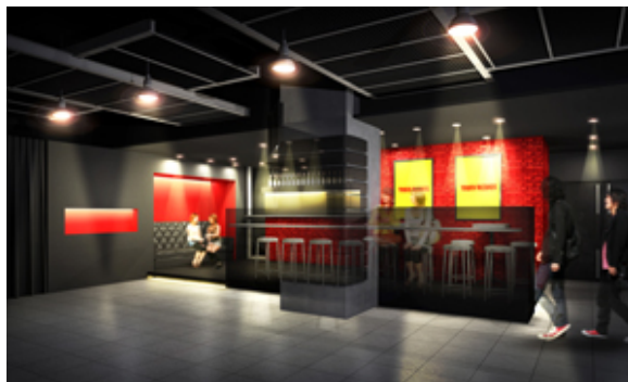
CUTUP STUDIO 内観