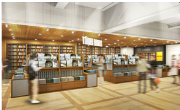
TOWER BOOKS 内観