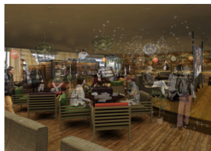
TOWER RECORDS CAFE 内観