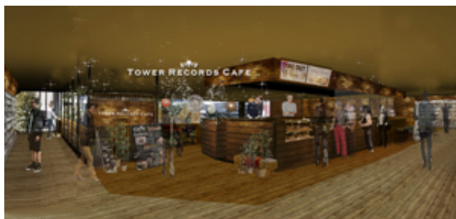
TOWER RECORDS CAFE 外観