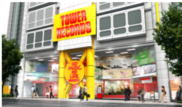
タワーレコード渋谷店リニューアル後外観イメージ

新しい渋谷店では、音楽の楽しみ方や接点が多様化している現在のマーケットに合わせ、単に CD、DVD/Blu-ray のお買い物だけではない、各フロアで行う各種ライブ、ストリーミング番組配信やインターネットでの情報発信、催事企画など、さまざまなチャネルやフォーマットでその時々旬なエンターテインメントと直に(=LIVE で)出会える場を提供していきます。