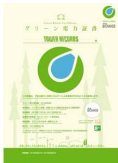
グリーン電力証書

渋谷店では、「Earth Day Tokyo 2013」開催期間を含む約 1 週間、昨年の夏 FES. で回収されたペットボトルから出来た「Earth Day Tokyo 2013」ショッピングバッグを使用します。夏 FES. での資源回収とリサイクルを連動させるこの活動を通じて、音楽の現場から持続可能な社会の提案と「Earth Day Tokyo 2013」の PR を行います。