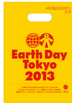
「Earth Day Tokyo 2013」ショッピングバッグデザイン ※ショッピングバッグのデザインは変更になる場合があります。