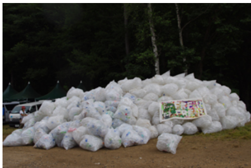
昨年の夏 FES. で回収されたペットボトル