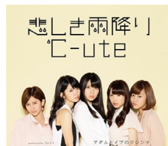
『悲しき雨降り／アダムとイブのジレンマ』 【通常盤 A】(EPCE-5965)