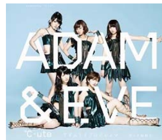
『悲しき雨降り／アダムとイブのジレンマ』 【通常盤 B】(EPCE-5966)