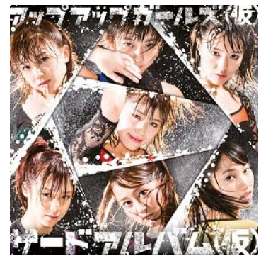
初回限定盤ジャケット写真