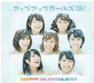
2013/12/25 release 虹色モザイク/ ENJOY!! ENJO(Y)!!