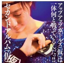
2014/2/19 release セカンドアルバム(仮) アップアップガールズ(仮)は 一体何と戦ってるんだ!!