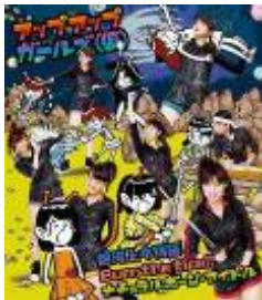
2013/6/5 release 銀河上々物語/ Burn the fire!!/ ナチュラルボーン・アイドル