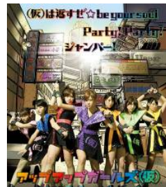
2013/4/9 release (仮)は返すぜ☆be your soul/ Party! Party! /ジャンパー!