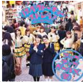
2013/2/20 release リスペクトキー /ストレラ! ~Straight Up!~