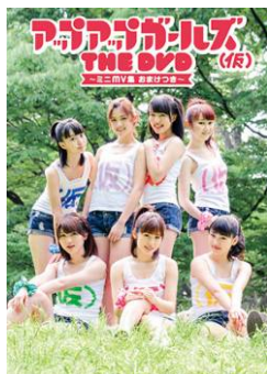
(DVD)2013/8/28release アップアップガールズ(仮) THE DVD ~ミニ MV 集 おまけつき~