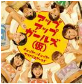
2012/12/5 release チョッパー☆チョッパー/ サバイバルガールズ