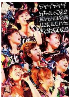
(DVD)2013/7/31release アップアップガールズ(仮) 3rd LIVE 横浜 BLITZ 大決戦(仮) (2 枚組)