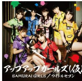
2013/9/4 release SAMURAI GIRLS / ワイドルセブン