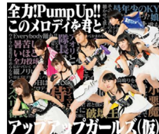
2013/7/1 release 全力 Up!! Pump Up!!/ このメロディを君と