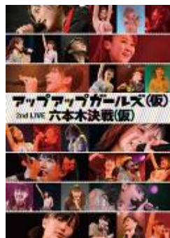
(DVD) 2013/4/3 release アップアップガールズ(仮) 2ndLive 六本木決戦(仮)