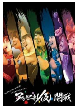
(DVD)2013/12/18release アップアップガールズ(仮) 1st ライブハウスツアー アプガ第二章(仮)開戦(2 枚組)