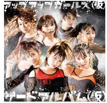
通常盤ジャケット写真