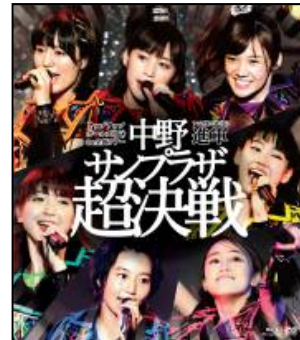
(Blu-ray)2014/9/30release アップアップガールズ(仮) 1st 全国ツアー アプガ第二章(仮) 進軍~中野サンブラザ 超決戦~ (Blu-ray&DVD2 枚組)