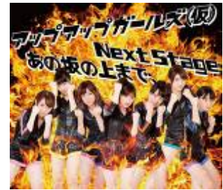
2013/4/10 release Next Stage/あの坂の上まで、 TPRC-0037 ¥1,000 (税込)