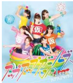
2013/7/24 release サマービーム!/ アップアップタイフーン