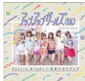
2013/10/30 release Starry Night/青春ビルドアップ