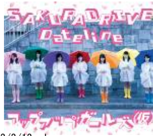
2013/3/13 release SAKURADRIVE/Dateline