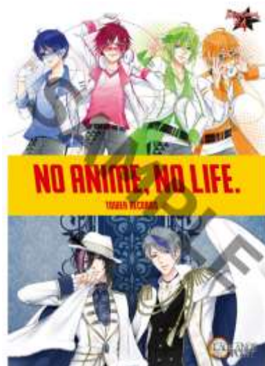
MARGINAL#4・LAGRANGE POINT スペシャルフライヤー

『LAGRANGE POINT THE BEST「Lag Juliet」』（キラ ver.）品番：REC-266