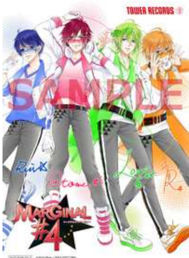
キャラクターサイン入りブロマイド （イラスト：MARGINAL#4 ver.）

『LAGRANGE POINT THE BEST「Lagjuliet」』（キラ ver.）品番：REC-266