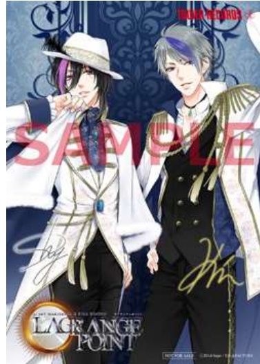
キャラクターサイン入りブロマイド （イラスト：LAGRANGE POINT ver.）