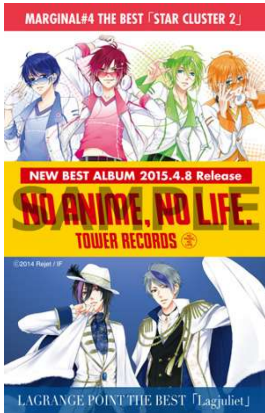
タワーレコード・クーポン （MARGINAL#4 ・ LAGRANGE POINT ver.）

ご取材ならびにこの件に関するお問い合わせ先 タワーレコード株式会社 広報室 谷河（やがわ）、伊早坂、松本 TEL : 03-4332-0705 Email : press@tower.co.jp