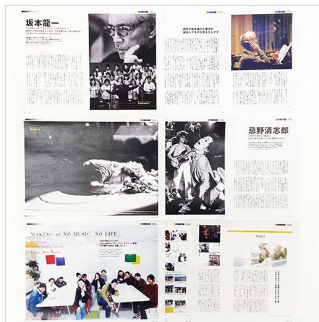
上から「NO MUSIC, NO LIFE. YEARBOOK 2016」目次、中面 (イメージ)