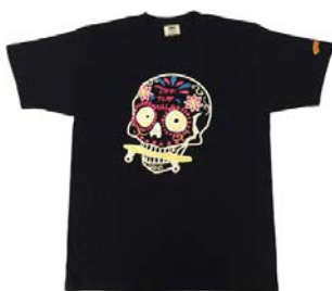
MEX SKULL Tee