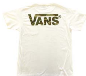
FLYING CAMO Tee (FRONT・BACK)