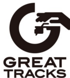
GREAT TRACKS のロゴ・マーク