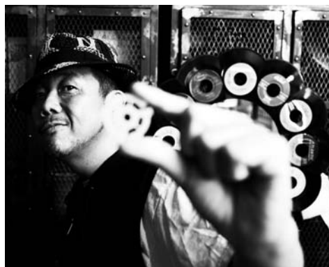
King of Diggin' MURO

ご取材ならびにこの件に関するお問い合わせ先 タワーレコード株式会社 広報室 谷河（やがわ）、松本、伊早坂 TEL : 03-4332-0705 Email : press@tower.co.jp