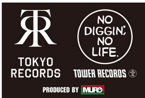
TOKYO RECORDS in TOWER RECORDS SHIBUYA ロゴマーク