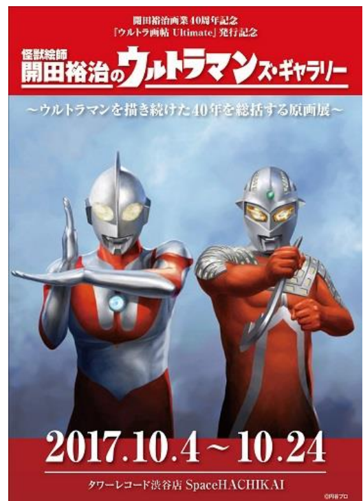
『ウルトラマンズ・ギャラリー』ポスター

さらに10月7日(土)をはじめ、全7回にわたり開田裕治氏の直筆イラスト付きサイン会も実施します。