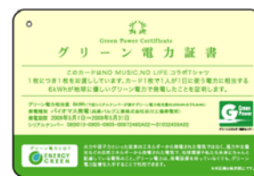
グリーン電力証書【イメージ】

このグリーン電力付き NO MUSIC, NO LIFE. T シャツを購入する事で地球そして未来の負担を軽減しています。タワーレコードは「音楽の現場から持続可能な循環型社会の実現」を進めています。