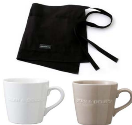
DEAN & DELUCA サロンエプロン & モーニングマグセット