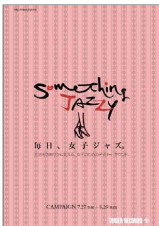
キャンペーン小冊子画像