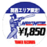
キャンペーンステッカー