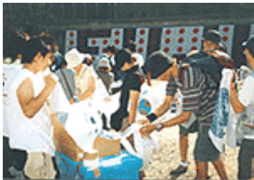
2003年 FUJI ROCK FESTIVAL での活動風景

2003年から、各会場で配布するゴミ袋は、2002年FUJI ROCK FESTIVALで回収されたペットボトルを初め、各会場で回収されたペットボトルのリサイクル原料を使用した再生フィルム素材製品“ポリペット”を使用しています。このゴミ袋は通常のゴミ袋に使用されているポリエチレンに比べ、燃焼カロリーが低く、焼却炉にかかる負担が少なくなります。さらに焼却時にポリエチレンから発生する二酸化炭素発生量を10%削減でき、有毒ガスである塩素が一切出ない、という環境に優しいものとなります。