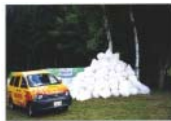
2003年 FUJI ROCK FESTIVAL で 回収したペットボトル