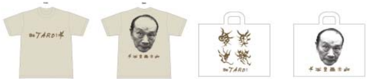
フェアトレード製品（Tシャツ、トートバッグ）

今年から、夏の環境活動で使用するTシャツやノベルティ（トートバッグ）にフェアトレードポリシー 1 を導入します。ノベルティ用Tシャツ NGO “PEOPLE TREE” より約200枚のTシャツを購入し、使用。ノベルティ用のエコバッグはオーガニックコットン製で5,000枚を製作します。