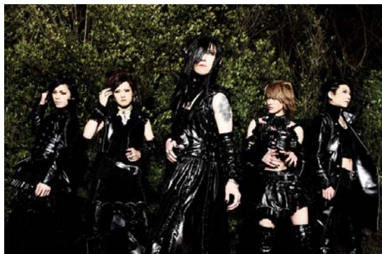
D © AEI

会場とネット上のオーディエンスが共通の体験を共有し一体感を楽しむことができる、新しいインストアイベントの形が実現します。