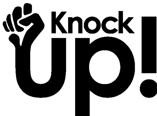
Knock up! ロゴマーク