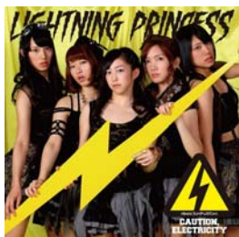
『電撃プリンセス』初回盤

ひめキュンフルーツ缶のメジャー2ndアルバム『電撃プリンセス』（初回盤または通常盤どちらか1枚）を対象店舗にてご購入いただいた方に、コラボレーションポスター（B2サイズ）を差し上げます。