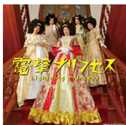
『電撃プリンセス』通常盤

「NO MUSIC, NO IDOL?」 コラボレーションポスター ひめキュンフルーツ缶