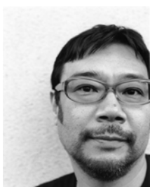
写真家 平間 至(ひらま いたる)

1963年、宮城県塩竈市生まれ。日本大学芸術学部写真学科を卒業後、イジマカオル氏に師事。躍動感のある人物撮影や、写真から音楽が聞こえてくるような作品により、多くのミュージシャン撮影を手掛ける。近年では舞踊家の田中泯氏の「場踊り」シリーズをライフワークとし、世界との一体感を感じさせるような作品制作を追求している。