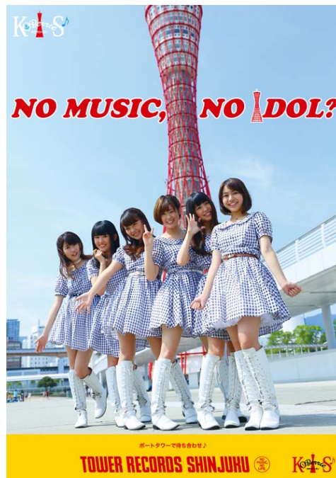
「NO MUSIC, NO IDOL?」コラボレーションポスター KOBerrieS ♪

タワーレコードでは、KOBerrieS ♪のニューシングル『シリアスの彼方』の発売を店頭から盛り上げてまいります。