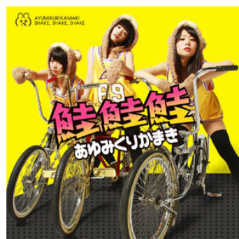
『鮭鮭鮭』 初回生産限定盤、通常盤