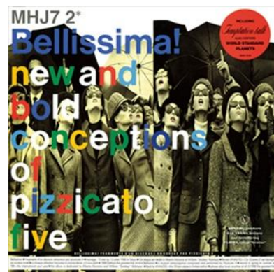
Pizzicato Five / Bellissima!

タワーレコード渋谷店 5F フロアの一部スペースに2016年7月15日（金）より期間限定にて復活オープンする南青山の伝説的なレコードショップ、『PIED PIPER HOUSE in TOWER RECORDS SHIBUYA』。その連動企画としてタワーレコードでは、期間中、“パイプパイパーハウス”店主：長門芳郎が制作に関わった名盤などを復刻させていただきます。