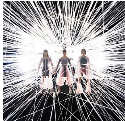
Future Pop ジャケット /完全生産限定盤(左)、通常盤(右)