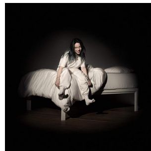
左より King Gnu 『CEREMONY』、SixTONES/Snow Man 『Imitation Rain/D.D.』、 Billie Eilish 『When We All Fall Asleep, Where Do We Go?』

<本件に関する報道関係各位からのお問合せ先> タワーレコード株式会社広報室 谷河（やがわ）、寺浦 TEL : 03-4332-0705（平日 9:30-18:30）Email : press@tower.co.jp