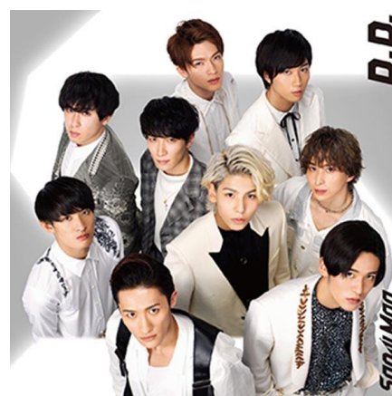
SixTONES (左) と Snow Man (右) 『Imitation Rain/D.D.』通常盤ジャケット (下)