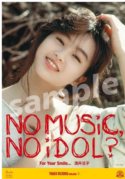
コラボポスターデザイン