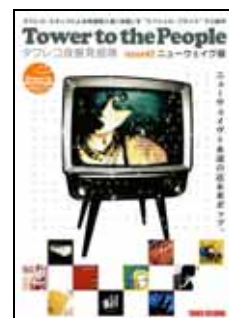
第2弾「ニューウェイヴ編」冊子