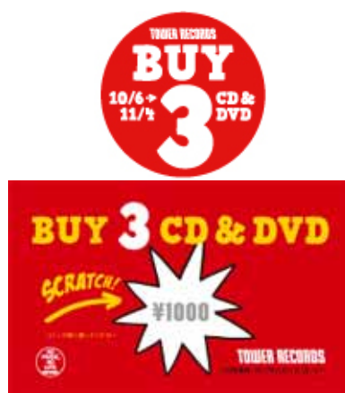
上/キャンペーン対象商品貼付ステッカー 下/スクラッチクーポン(当選例)