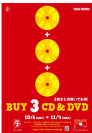
キャンペーン・ポスター