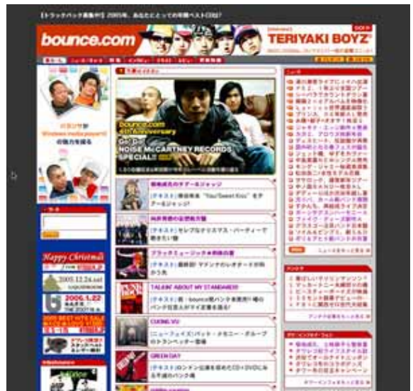
キャンペーン期間中のbounce.comイメージ

菊地成孔によるJ-POP売上予想企画「CDは株券ではない」 1 、トラックバック機能を活用したプロガー参加型批評実験企画「菊地成孔のチアー&ジャッジ」をはじめ、くるり/佐藤歴史が彼らの自主レーベルNOISE McCARTNEY RECORDS 2 に届いた一押しデモテープ音源を紹介する「Go! Go! NOISE McCARTNEY RECORDS」、ZAZEN BOYS向井秀徳によるプレイリスト語りおろし企画「向井秀徳の妄想処方盤」など、WEBならではの連載企画等も展開してきました。