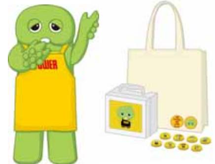
ガチャピン店長 1/2ぬいぐるみ第1弾