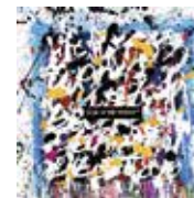
ONE OK ROCK 『Eye of the Storm』