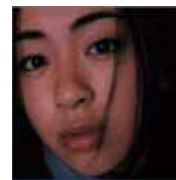
宇多田ヒカル 『First Love』