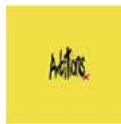
ONE OK ROCK 『Ambitions』