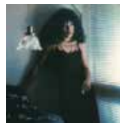
吉田美奈子 『TWILIGHT ZONE』