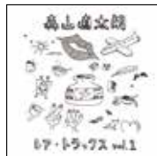
森山直太郎 『レア・トラックス vol.1』