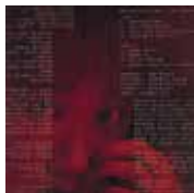
戸川純 『好き好き大好き』