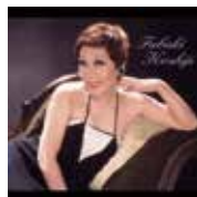
越路吹雪 『越路吹雪・愛の生涯』