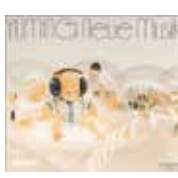
松任谷由実 『ノイエ・ムジク YUMI MATSUURA COMPLETE BEST VOL.1』