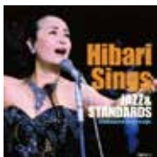
美空ひばり 『美空ひばりシングス ジャズ & スタンダード』