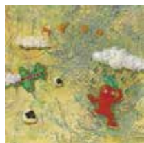
うずまき 『ヒコノキのうた』