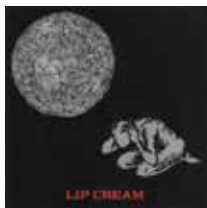
Lip Cream 『Lip Cream』