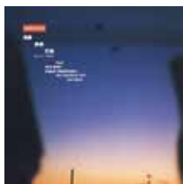
Choro Club 『Sonora』