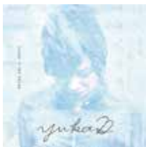
yukaD 『yukaD in the house』