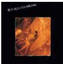
中島みゆき 『愛していると云ってくれ』