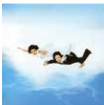
サディスティック・ミカ・バンド 『黒船』